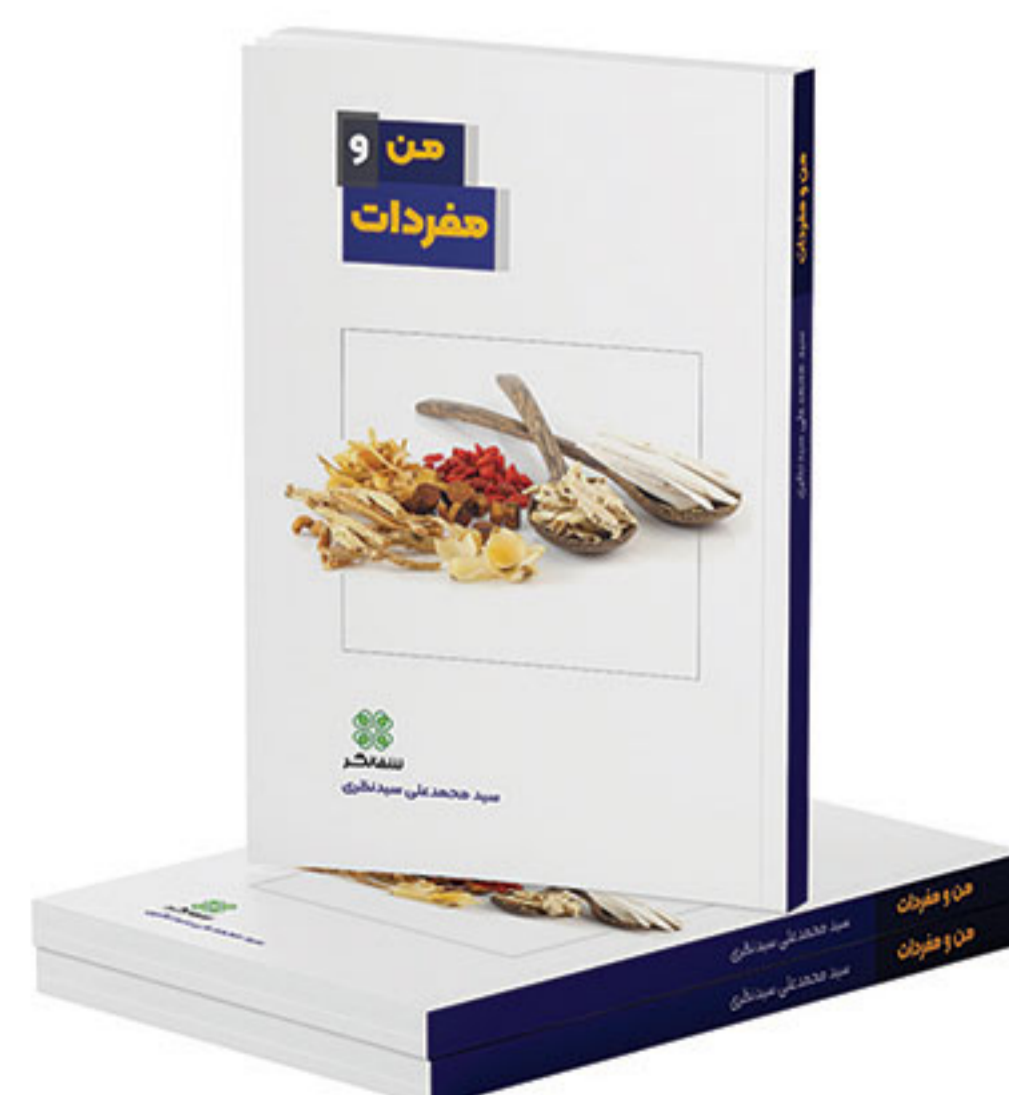
من و مفردات