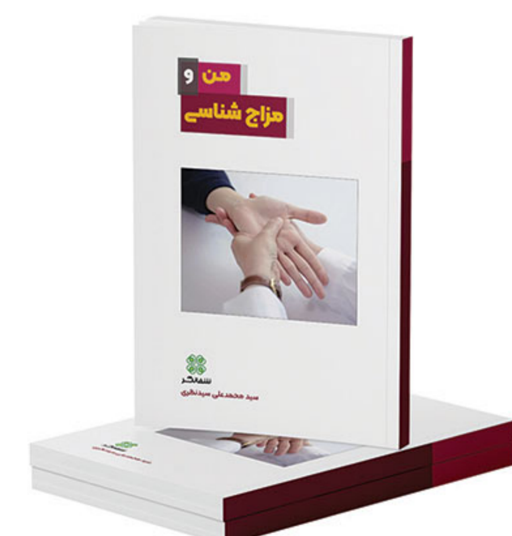
من و مزاج شناسی