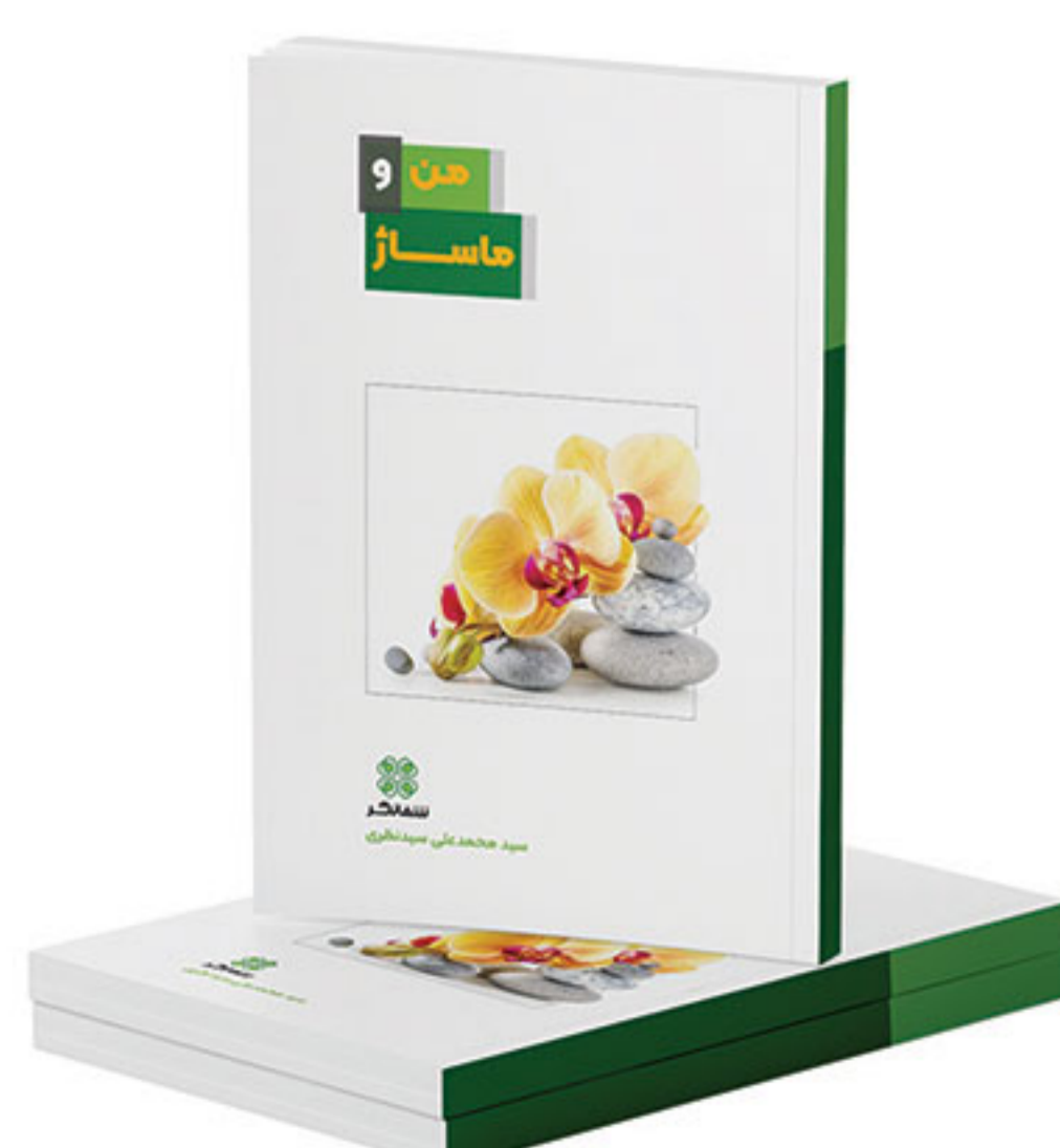
من و ماساژ